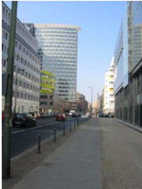
Blick entlang Kochstrasse gen Westen