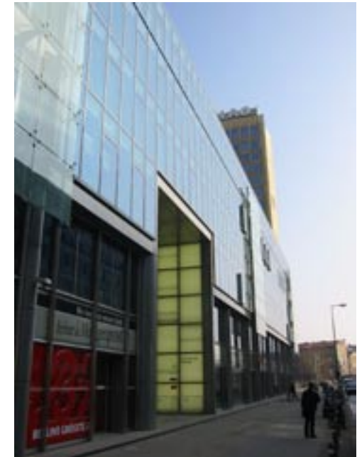
Blick entlang Kochstrasse gen Osten